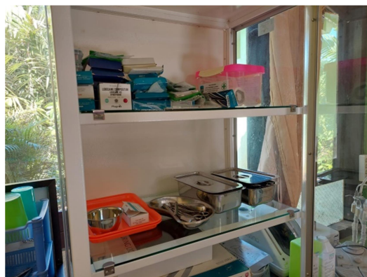
Gambar 1.3 Rak alat dan bahan di poli gigi BLUD Puskesmas Selasari

Fakta di lapangan saat ini di poli gigi BLUD Puskesmas Selasari ketersediaan alat dan bahan untuk menangani permasalahan gigi masih kurang. Hal ini menyebabkan terbatasnya tindakan yang dapat dilakukan di poli gigi BLUD Puskesmas Selasari.