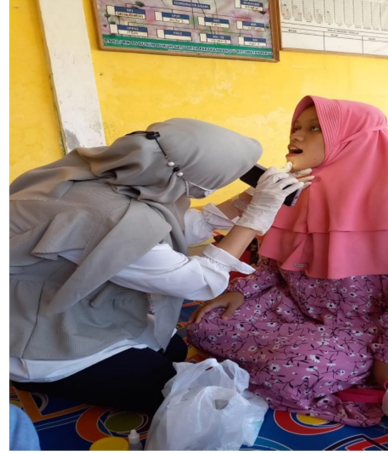
Gambar 1.1 pemeriksaan gigi pada ibu hamil